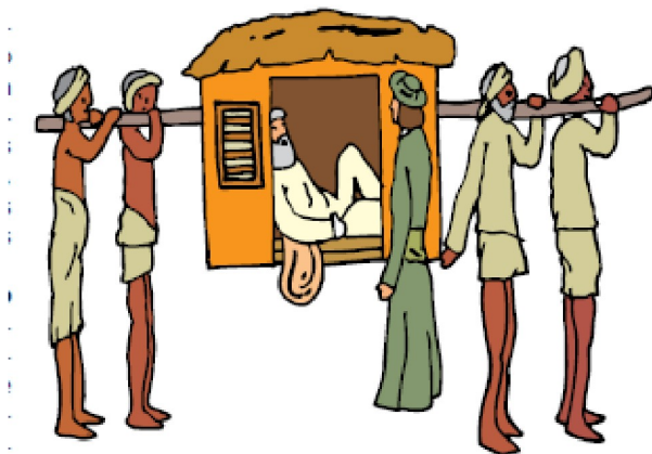
El control de las potencias dominadoras se reflejó tanto en el aspecto social como en el económico. El europeo tomaba las materias primas sin desarrollar industrias o fomentar el bienestar de las colonias.

Francia: tomó posesión de los territorios ubicados en parte importante del este del continente desde el norte hasta el centro del África. Llegó a dominar los actuales territorios de Argelia, Túnez, Marruecos, Mauritania, Senegal, Malí, Guinea, Camerún, Costa de Marfil, Níger, Alto Volta o burkina Faso, Benín, parte de África Ecuatorial, Gabón, República del Congo, República Centroafricana, Chad, parte de Somalia, Yibuti, Madagascar y Comoras.